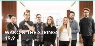
WAKO & THE STRINGS 19.9