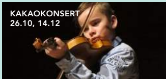
KAKAOKONSERT 26.10, 14.12

Sundag 20. oktober kl 18 FOLK: MAJORSTUEN – SKRIBLE Publikumsfavorittar med inspirasjon frå litteraturen – frå Holberg til Grytten.